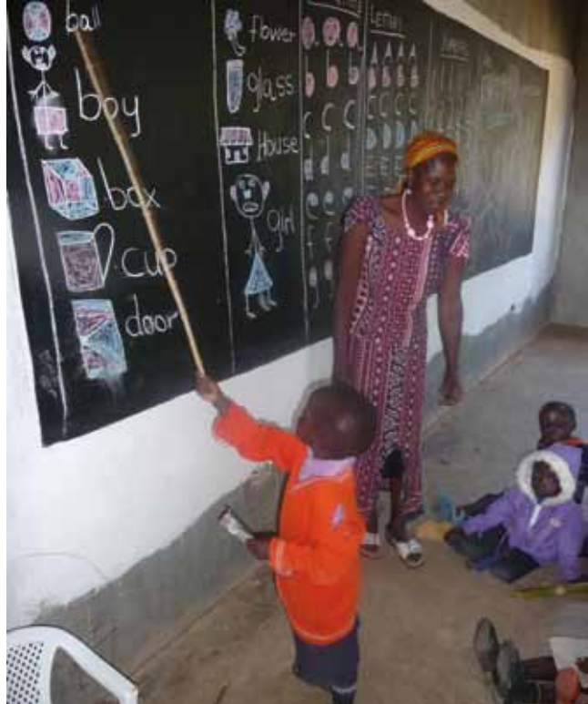
Kleuters krijgen al les op Hafoland PS

Op Kamusinga Primary School worden momenteel twee slaapzalen, inclusief sanitaire voorzieningen gebouwd die nagenoeg klaar zijn. Aan de bouw van de keuken moet nog begonnen worden. De volgende fase bestaat uit een huis voor de directrice. De kerk die sponsor van de school is en de gemeenschap samen zorgen voor de