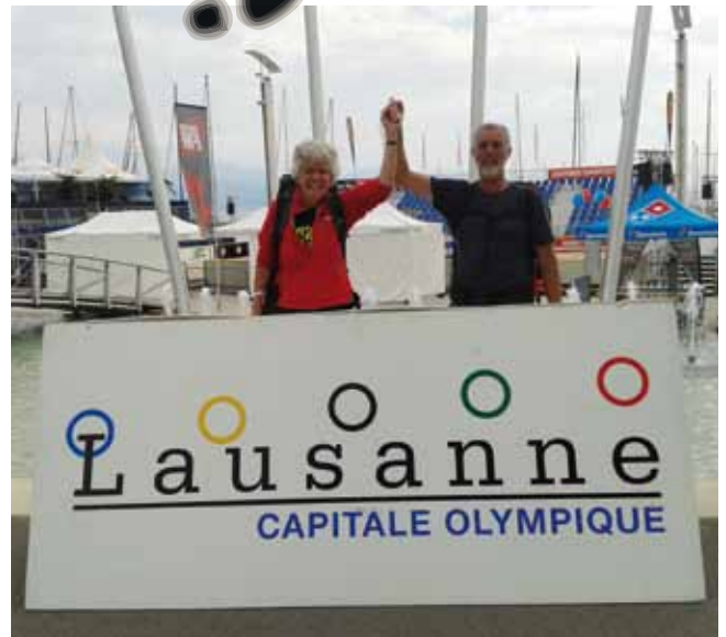
875 km lopen: een Olympische prestatie?

'Dat blijft voor ons een herinnering die we niet zullen vergeten.'