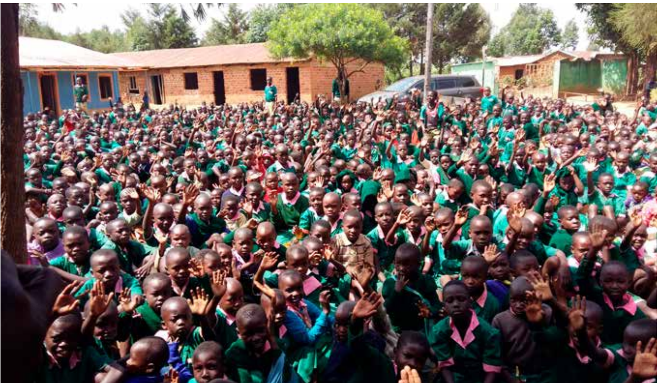
Makunga PS alle kinderen in groene uniformen.

Eindelijk is het zover: de registratie van Harambee Foundation Kenya is een feit en het langverwachte certificaat is ontvangen. Na veel geduld kunnen we nu een belangrijke stap zetten naar de toekomst.